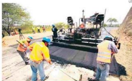
El JNE requerirá cerca de S/. 101 millones para afrontar elecciones.

Partidos fragmentados El secretario general de